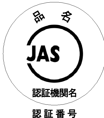
図 2—化粧ばり構造用集成柱の格付の表示の様式